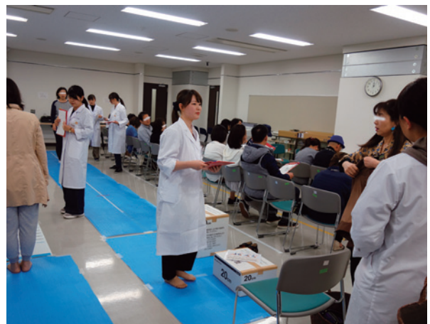
学生による測定の様子