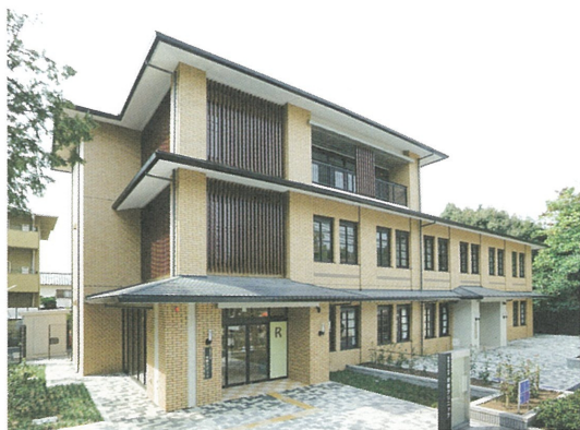
栄養クリニックの外観